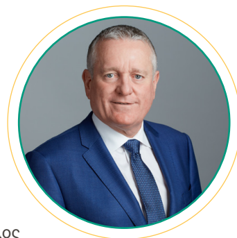
George Burns Πρόεδρος & Διευθύνων Σύμβουλος

Ο καθένας μας διαδραματίζει ουσιαστικό ρόλο στη διατήρηση μιας κουλτούρας ακεραιότητας σε όλη την Eldorado.